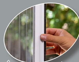
PORTA CON ZANZARIERA